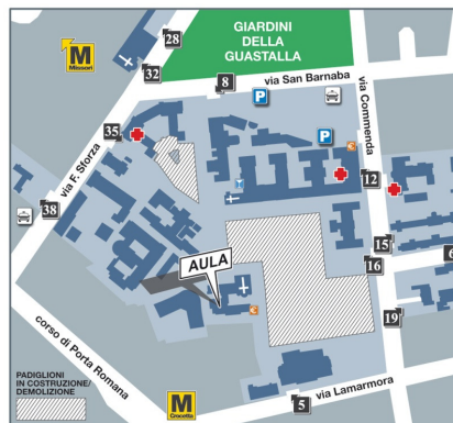
Polo scientifico 2° piano

Autobus 60, 73, 84 fermata Vittoria-Augusto